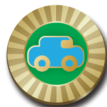
ゴールド仕上げ ダイヤモンドカット