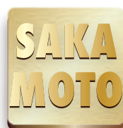
ゴールド仕上げ 文字光沢磨き