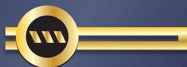
ゴールド仕上げ のせこ式