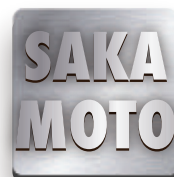
銀いぶし仕上げ (銀古美)