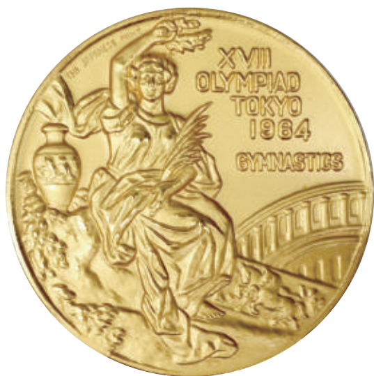
東京オリンピック 1964 メダルレプリカ

記念メダル・オリジナルコインは、小ロットから製造いたします。ゴールド・シルバーの仕上げ、金古美・銀古美などのアンティーク風、ガンメタリックなどさまざまな仕上げに対応します。