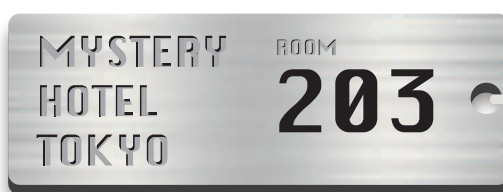
ホテルキーホルダー シルバー・サテーナ仕上げ