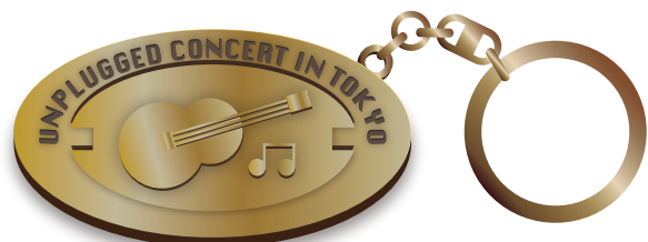
コンサートグッズ ゴールド・金古美仕上げ

ホテルキーホルダー、コンサート・イベントキーホルダーなど、 金属がもつ高級感、重厚感を生かしたキーホルダーをオーダーメイドで製作。